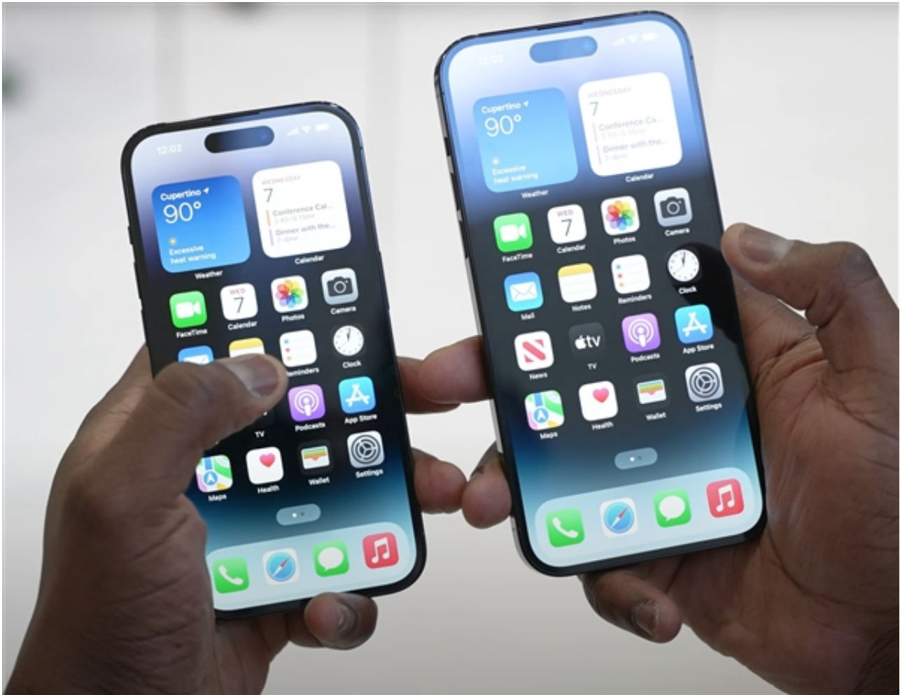
iPhone 14 Pro左，重206g

综上所述，小米13做到了轻薄设计，仍然实现了单手操作，这将是新一代单手操作神器。