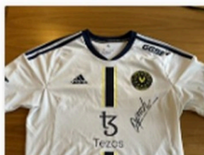
8 Bid(s) #12 Trøjen som dupreeh vandt ESL P...

CURRENT BID TIME REMAINING kr.260.00 4 Days 04:55:56