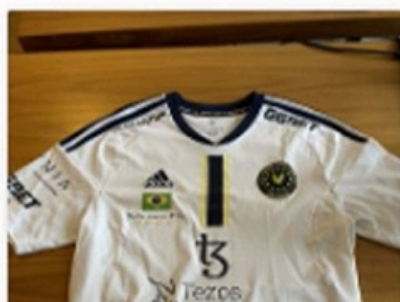
4 Bid(s) #13 Rio Major special edition trøje, m...

CURRENT BID TIME REMAINING kr.260.00 4 Days 04:55:56