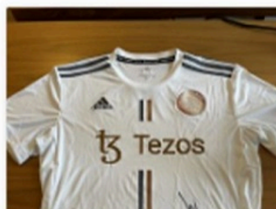
12 Bid(s) #15 T-shirt i de franske farver, brugt v...