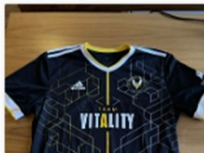
16 Bid(s) #9 Første T-shirt dupreeh spillede i fo...

CURRENT BID TIME REMAINING kr.220.00 4 Days 04:55:56