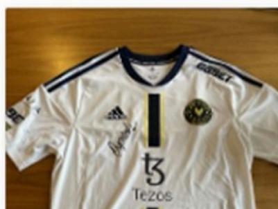
7 Bid(s) #11 Trøjen som dupreeh vandt ESL P...

CURRENT BID TIME REMAINING kr.410.00 4 Days 04:55:56