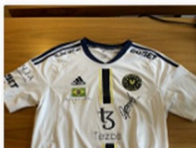
3 Bid(s) #14 Rio Major special edition trøje, m...