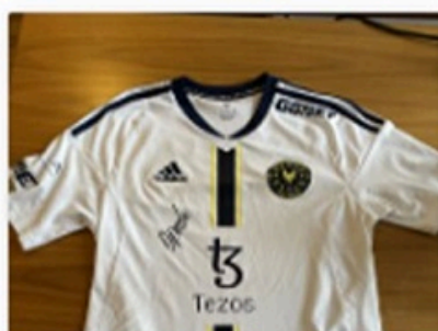
6 Bid(s) #10 Trøjen som dupreeh vandt ESL P...

CURRENT BID TIME REMAINING kr.340.00 4 Days 04:55:56