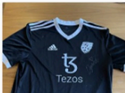
4 Bid(s) #8 T-shirt: Antwerp Major special edit...

CURRENT BID TIME REMAINING kr.260.00 4 Days 04:55:56