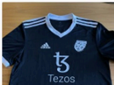
4 Bid(s) #7 T-shirt: Antwerp Major special edit...

CURRENT BID TIME REMAINING kr.260.00 4 Days 04:55:56