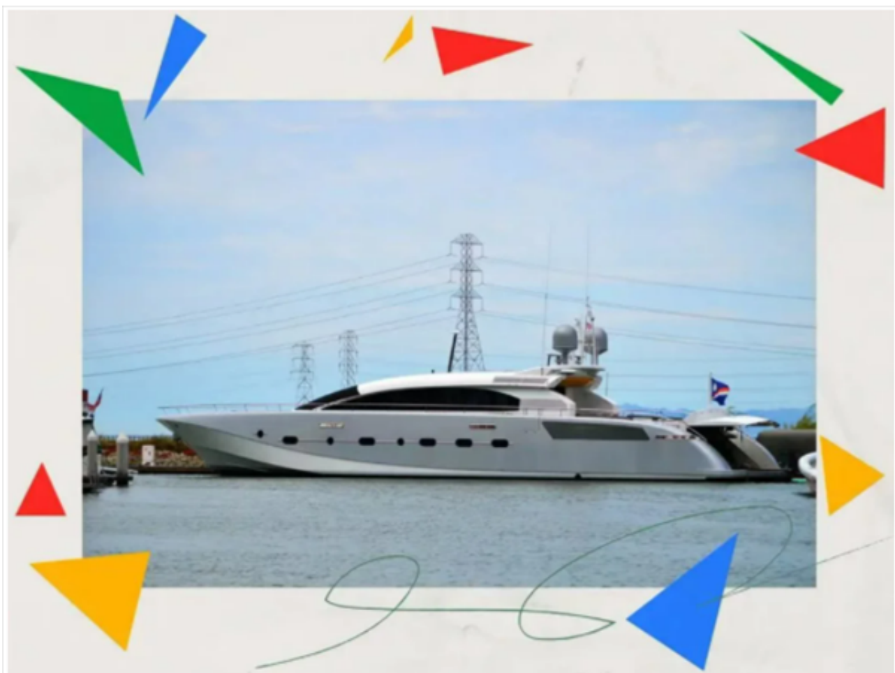
布林的“蜻蜓号”游艇

佩奇和布林都很享受游艇生活，这已经成为超级富豪最明显的身份象征之一。但是随着佩奇在私人岛屿上的投资增加，他一直在减少自己的船队。据熟悉佩奇在南太平洋活动的人士透露，佩奇卖掉了他的超级游艇“感官号”(Senses)，改用了各种较小的船只。