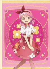
まどか JAN : 4549743856186