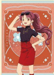
杏子 JAN : 4549743856223