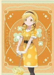
マミ JAN : 4549743856209