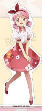
まどか JAN : 4549743856131