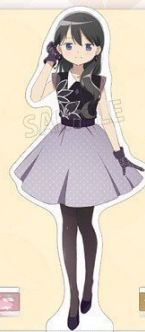
ほむら JAN : 4549743856148