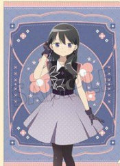
ほむら JAN : 4549743856193