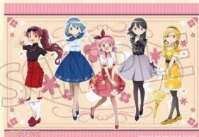
▲特典 (A3 サイズ布ポスター)