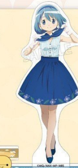
さやか JAN : 4549743856162