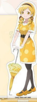
マミ JAN : 4549743856155